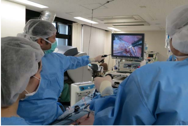
国立病院機構内視鏡手術セミナー(東京医療センタートレーニングセンター)