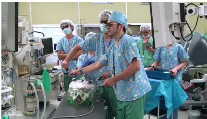
腹腔鏡下鼠径ヘルニア修復術のシミュレーショントレーニング(東京医療センター 手術室)