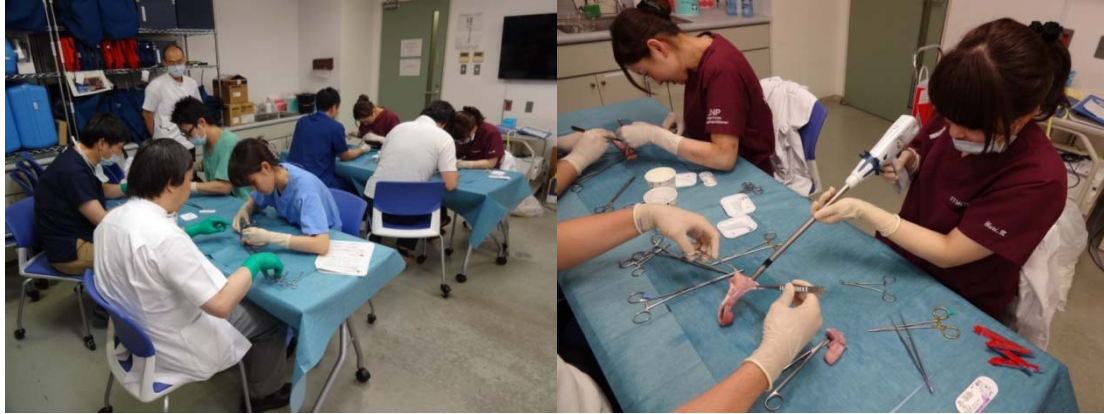
消化管手縫い・器械吻合トレーニング(東京医療センター シミュレーションルーム)