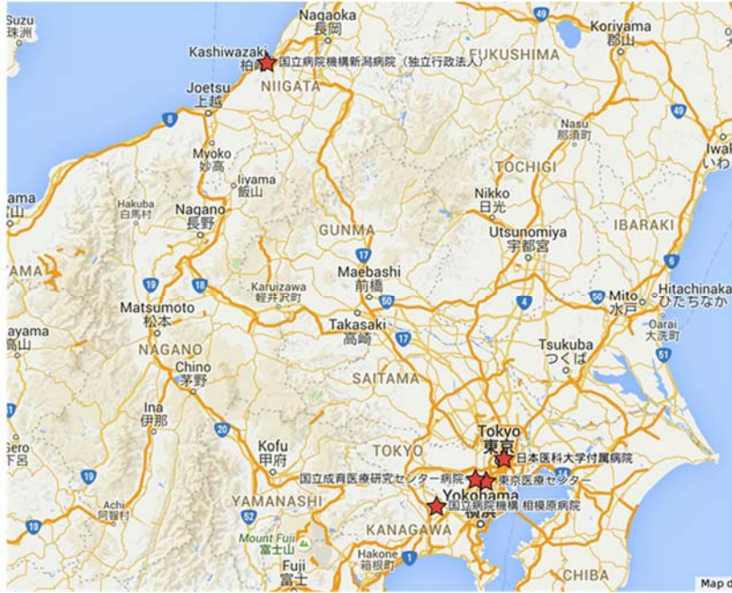
研修プログラムを構成する5施設の所在地