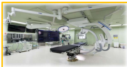
血管内治療用のハイブリッド手術室 (手術設備 + 血管造影装置)