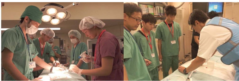
シミュレーション室での手技指導