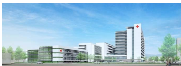
(松山赤十字病院ホームページより：2021年グランドオープン図)

(病院紹介) 当院は1913年に開院し、創立から105年の歴史のある病院です。病床数は632床、約1500名の職員(内約200名の医師)が、年間6,671件(2017年)の手術と年間4,200台の救急車で受け入れ患者に対応しています。待機手術、急患手術どちらも十分に学べます。年間NCD登録手術件数は1917件で毎年3名の外科専攻医を受け入れることができます。