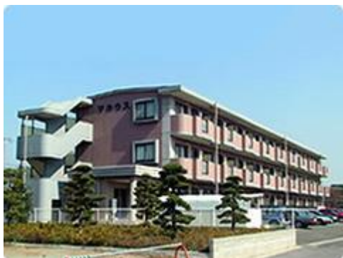
【職員宿舎マカウス】