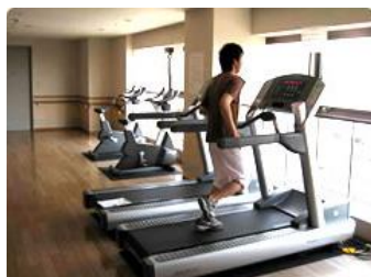
【職員用トレーニングルーム】