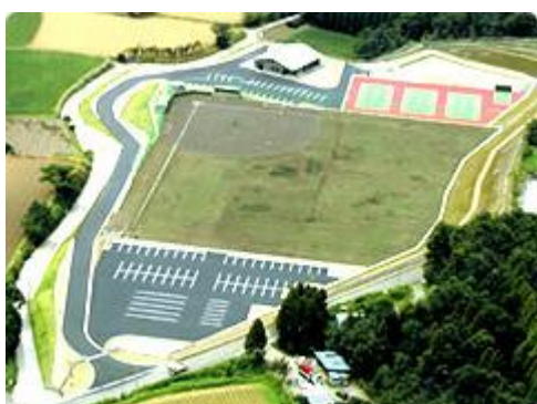
【病院グラウンド】 野球場、テニスコート