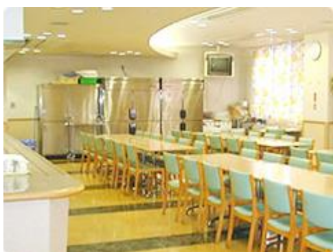
【職員食堂】 定食メニューは毎日変わります