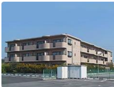
【職員宿舎リブレコート】