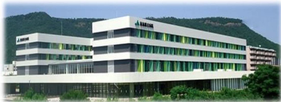
新築移転病院 2016年11月診療開始