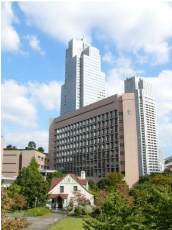
聖路加国際病院本館(520 床)と、トイスラーハウス。隅田川沿いには聖路加タワーが建っています。

本プログラムの特徴は、3年間の研修のうち2年間以上を総合病院である基幹施設で腰をすえて標準的手術の修練に専念し、残りの期間に多彩な連携施設において専門性の高い手術の研修を補完することにあります。