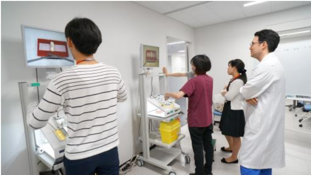
米国外科学会の Fundamentals of Laparoscopic Surgery (FLS) に基づいたトレーニング（聖路加シミュレーションセンター）