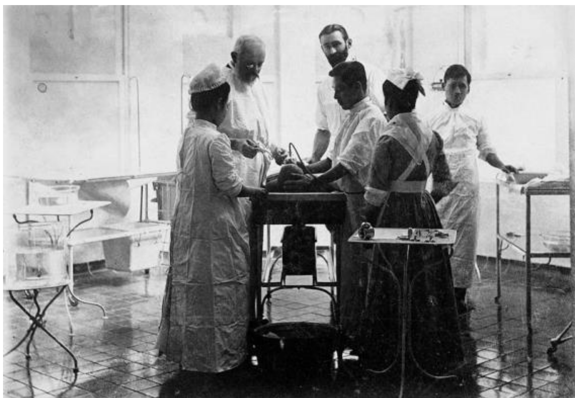
1904年（明治37年）聖路加国際病院医手術室

2018年度から開始された新外科専門制度の下では、外科サブスペシャリティ領域6科（消化器外科、心臓血管外科、呼吸器外科、小児外科、乳腺外科、内分泌外科）が加わったオール聖路加と多彩な連携施設が協力しあって、外科医を育てる専門研修プログラムを作成しました。