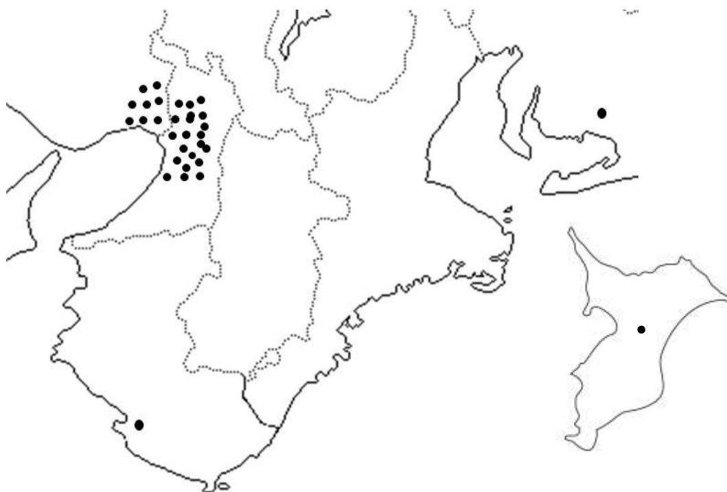
大阪大学眼科関連病院の分布図（●関連病院）