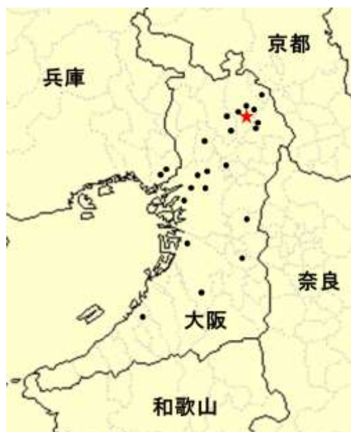
大阪医科大学眼科学教室 関連施設の分布図 (●関連施設)