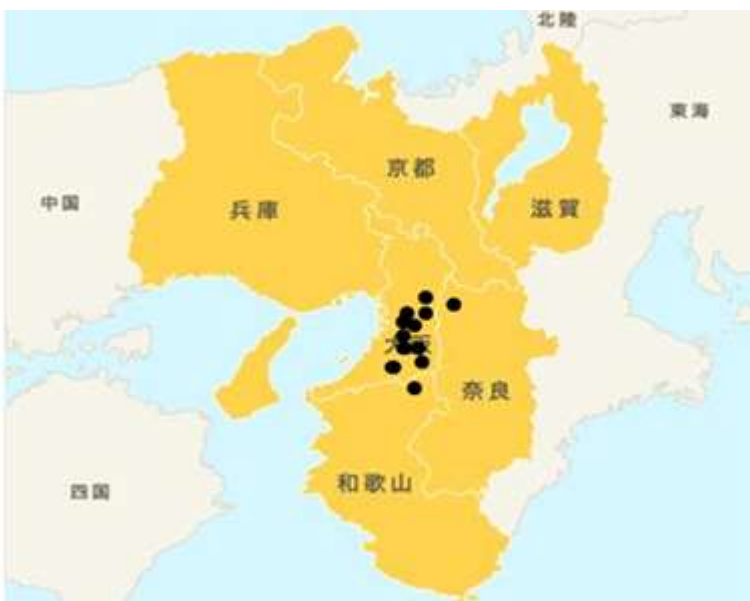
近畿大学眼科関連施設の分布図 (●関連施設)

当教室は専門研修基幹施設である近畿大学附属病院(大阪狭山市)の他に関連 12 施設を有する。これらの施設に、当教室の医局員 23 名の医師が派遣されている。この現場を活かし、専門研修基幹施設だけでは経験が不足しがちな初期の一般的な疾患など幅広く研修を行える場を提供する。大学附属病院での最先端の専門的診療経験と地域病院での即戦力となる臨床経験によって、眼科専門医を育てることが当プログラムの目指すところである。