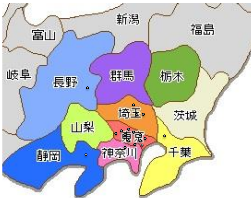
順天堂大学眼科関連施設の分布図( ● 関連施設)