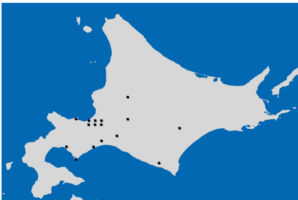
札幌医科大学眼科関連施設の分布図 (●関連施設)